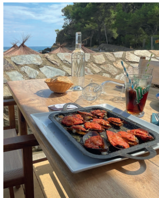
Sander Cox | Eimert Pruis en Shutterstock

Gelukkig hebben ze daar bij sterrenrestaurant Pascal Borrell-Le Fanal in Banyuls-sur-Mer wel verstand van. Als we de ober naar de lokale wijnen vragen, volgt er een uitgebreide opsomming terwijl hij meetelt met zijn handen. We hebben geen idee wat we kunnen verwachten. Daarvoor is onze Franse taal- en