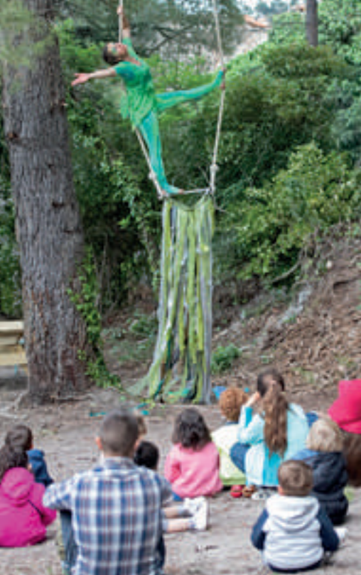
Balade spectacle « Fous de nature » au Château de Castelnou par la Compagnie Cielo.