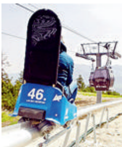
LOU BAC MOUNTAIN

Attraction de la station des Angles, la luge estivale vaut assurément le détour. Sur un monorail de 2 kilomètres et 430 mètres de dénivellé négatif, il est