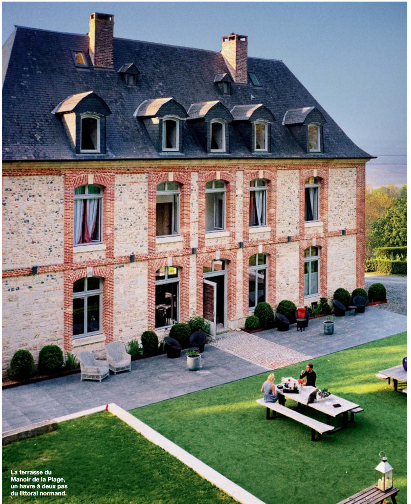
La terrasse du Manoir de la Plage, un havre à deux pas du littoral normand.