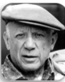
PABLO PICASSO (1881-1973)