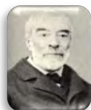
CHARLES RENOUVIER (1815-1903)