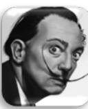
SALVADOR DALÍ (1904-1982)