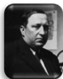
ANDRÉ DERAÏN (1880-1954)

Considerat un dels fundadors del fauvisme, fins a la Primera Guerra Mundial, André Derain participa a les grans aventures de l'art modern i, després, va preferir una pintura més figurativa.