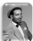
CHARLES TRENET (1913-2001)

Ensenyant i infermera, aquesta filla d'un pastor suís va ser la fundadora de la Maternitat Suïssa d'Elna al castell dels Bardou Job. Entre el 1939 i el 1944, prop de 600 fills de refugiats van néixer, en bones condicions, a aquesta maternitat. Restaurada per l'Ajuntament, la Maternitat d'Elna ha esdevingut un centre d'exposicions i un lloc cultural.