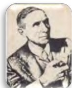
POMPEU FABRA (1868-1948)

Hereu d'una poderosa nissaga, a la vegada riquíssim industrial, gran burgés i amant de l'art, també va ser el polític rossellonès més important de principis del segle XX.