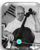
PAU CASALS (1876-1973)