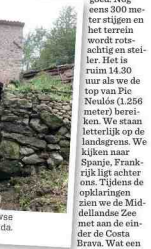
De middelenwegse watermolens Peds.

doornese bergsapper circa 300 meter stijgt per uur, dan zijn we al minstens vier uur be-