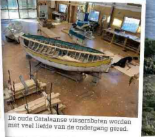
De oude Catalaanse vissersboten worden met veel liefde van de ondergastig geresit.