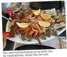
De zoutvruchtschotel op de kade van de vissershaven, verser kan het niet.

C euwige getuigen. Gids Catherine loodt mij vandaag langs de Sentier Littoral, letterlijk vertaald, het pad in het kustgebied. De naam verradt al veel, het wordt geen wandeling "langs het zeeje". Het gaat flink op en af, telkens naar tientallen meters, maar opnieuw en opnieuw in opnieuw. Gelukkig met af en toe een rustpauze om de schoonheid van de omgeving in ons op te nemen. Opvallend zoewater tegen de soms indrukwekkende rotsklimmen van wel 50 meter hoog, een landschap met de vuurtoren van Cap Béar, stiele afdalingen, geflankeerd door agrivormen, slingerend naar kleine openbare strandjes. De Plages Balanti, Bernardi en Paillies zijn stuk voor stuk paradijs. Gelukkig zijn ze beschermd, er kan en mag hier niets gebouwd worden. Tussen twee zo'n strandjes is kon je zelfs zwemmen en snorkelen in de cryques, kreeftjes met water dat zo helder is dat het onderwaterleven kan gespot worden. Achter het strand van Paillies brengen we nog een bezoek aan L'Anse de Paillies. Een geklasseerde site met een openluchtmuseum op de terrassen van een voormalige dynamietfabriek gebouwd door Alfred Nobel in 1870. Eén van de voormalige magazijnen is omgebouwd tot restaurantotelier van burgemeester Catalanes, oude Catalaanse vissersboten. Met handarbeid en heel veel liefde worden de zeilboten hersteld.