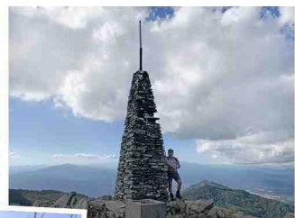
De klin naar de Pic Neulós (1.256 meter) is vrolijk.

Na het ontbijt rijden we naar Laroque des Albères, het geen negen kilometer van Argelès-sur-Mer. On-