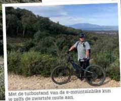
Met de turbostand van de e-mountainbike kun je zelfs de zwartste route aan.

We rijden naar Port-Vendres, het enige stadje aan de Côte Vermeille met een vissers- en handelshaven. Naast de containertrafiek met fruit uit Afrika is er een nog vrij actieve vissersvloot. De wandeling start aan Redoute Béar, een van de drie vestingen gebouwd door Vauban, ter bescherming van de havengeul. De immense muren met de nog aanwezige kanonnen zijn de