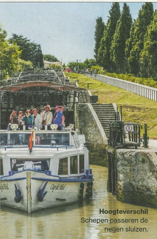
Hoogteverschil Schepen passeren de negen sluizen.