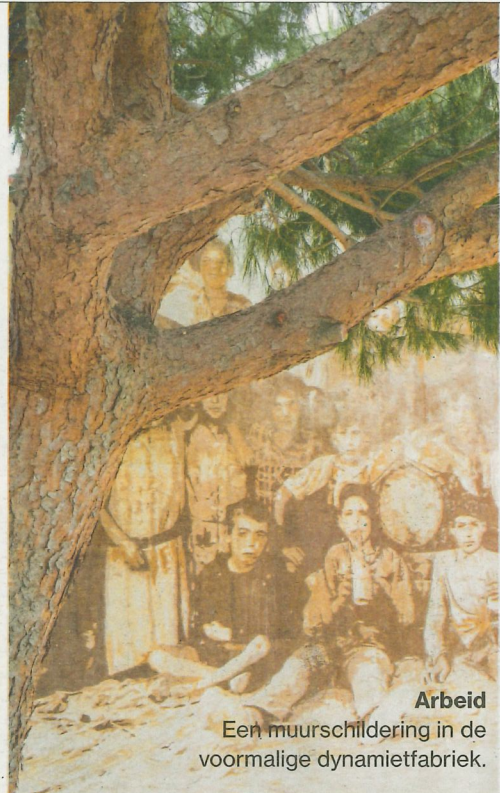
Arbeid Een muurschildering in de voormalige dynamietfabriek.