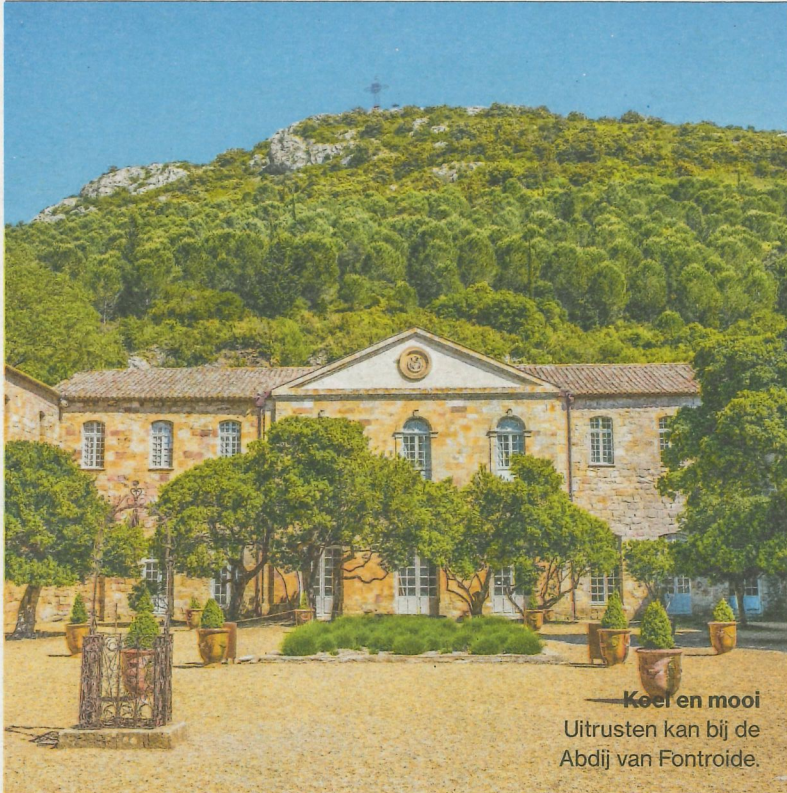
Koel en mooi Uitrusten kan bij de Abdij van Fontfroide.