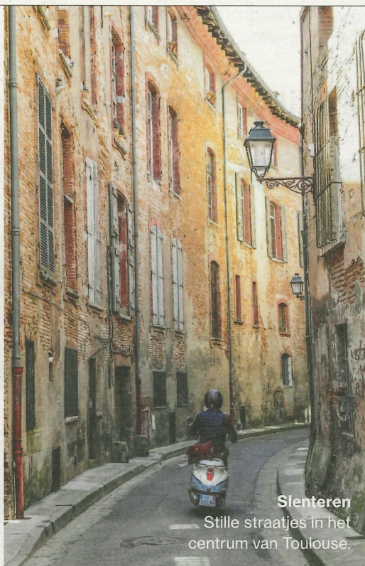
Slenteren Stille straatjes in het centrum van Toulouse.