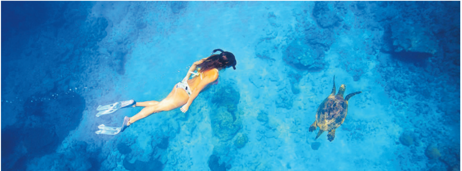
Una mujer practica snorkel junto a una tortuga en las aguas del Océano Pacífico, en Costa Rica. Abajo, una excursión para observar ballenas y delfines. A la derecha, una lapa roja.

A pesar de su pequeño tamaño, Costa Rica está considerado como uno de los 25 países más biodiversos del planeta.