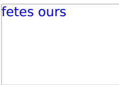
Fêtes de l'Ours dans les P.O