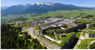
Citadelle de Mont-Louis

Ce label obtenu par le réseau des sites Vauban en 2008 est l'un des plus prestigieux des labels patrimoniaux.