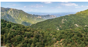
Hêtraie de la Massane